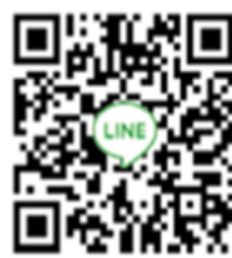
育達科大招生諮詢