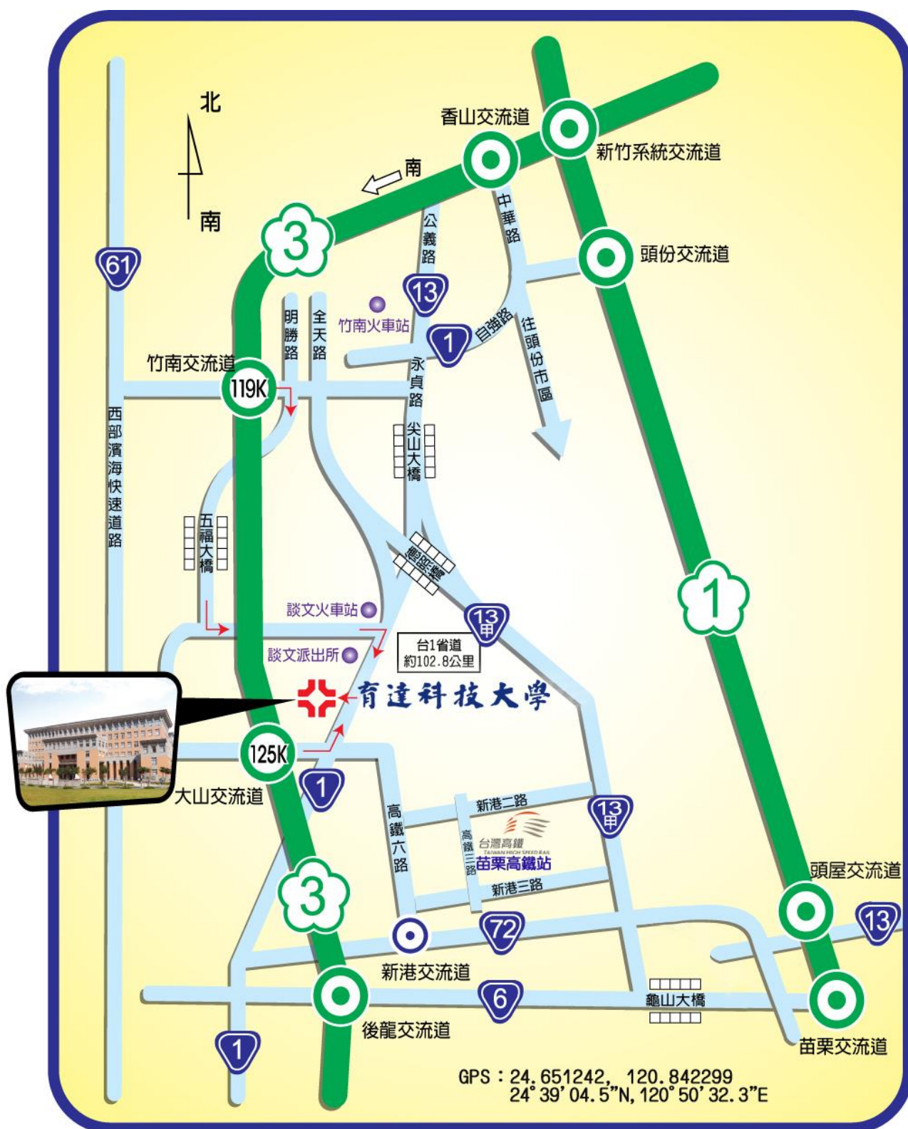
本校位置及交通路線圖