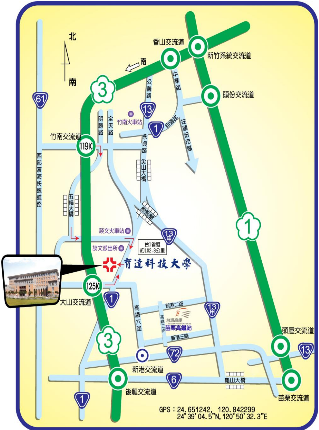
本校位置及交通路線圖